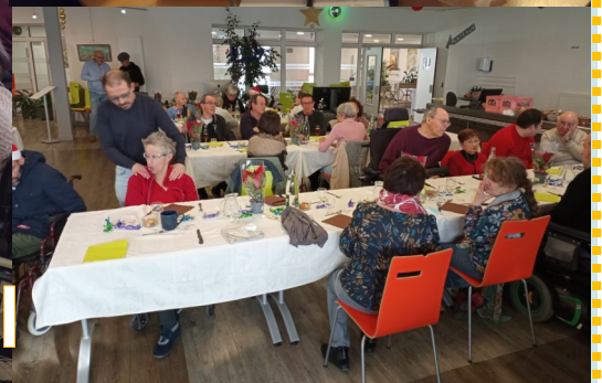
Repas de Noël