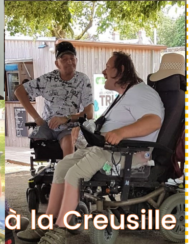
Pique-nique à la Creusille