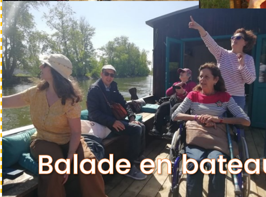
Balade en bateau à Orléans