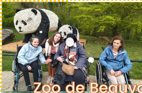
Zoo de Beauval