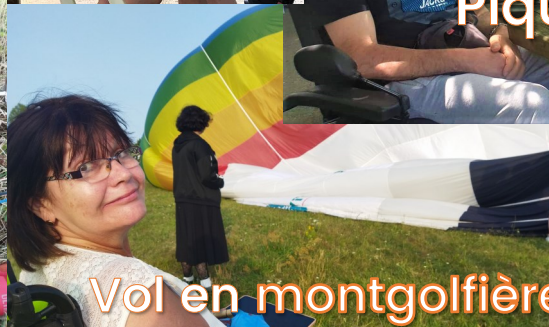
Vol en montgolfière