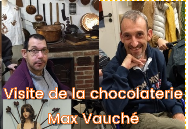
Visite de la chocolaterie Max Vauché